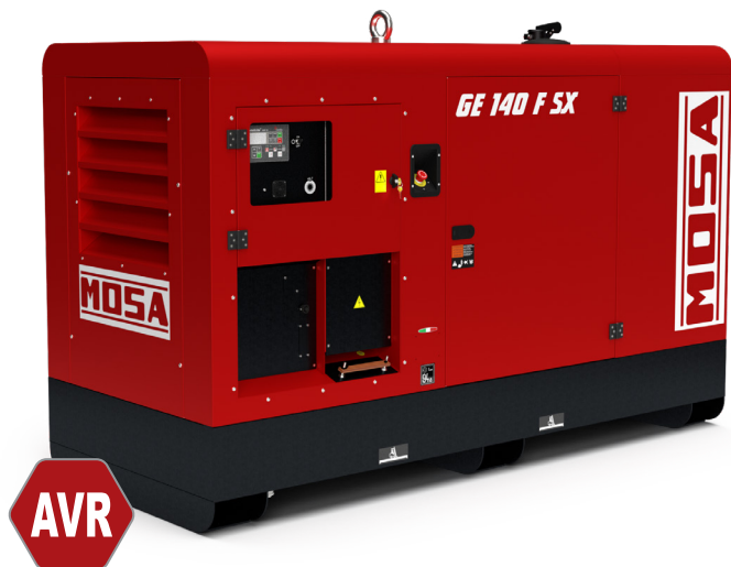
Imagem apenas para referência