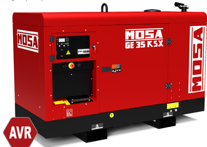
Imagem apenas para referência